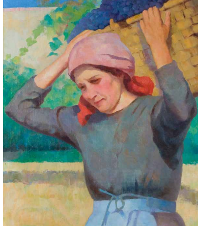
Regina Conti, Contadina che vendemmia , olio su tela, Massagno, 1926

25 settembre, Sala Meili del Consolato generale di Svizzera a Milano, Via Palestro 2